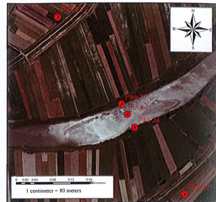
SISTEMI I REFERIMIT - KRGJSH