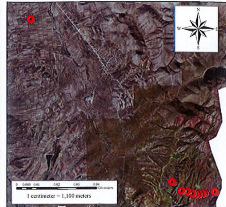
SISTEMI I REFERIMIT - KRGJSH