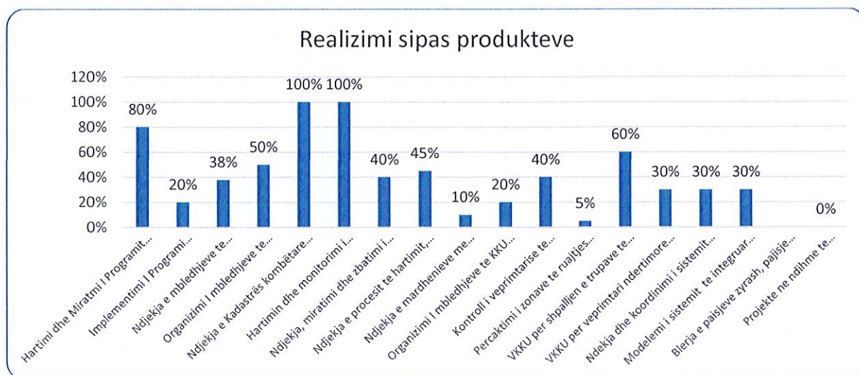
Grafiku 3 Realizimi sipas produkteve

Në mënyrë grafike realizimi i produkteve paraqitet: