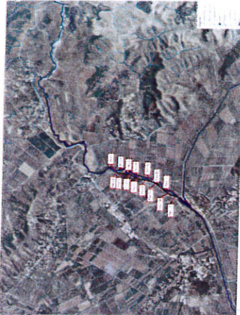
SISTEMI REFERIMIT - KRGUSH